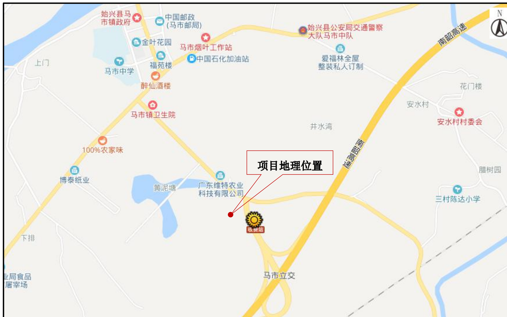
附图 1 项目地理位置图