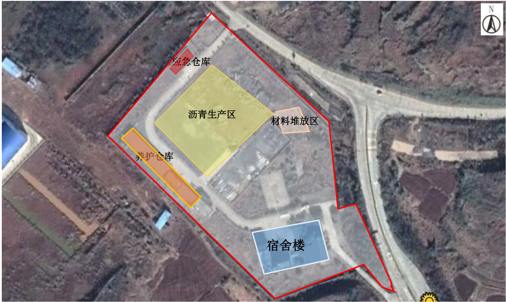
附图 3 项目平面布置图