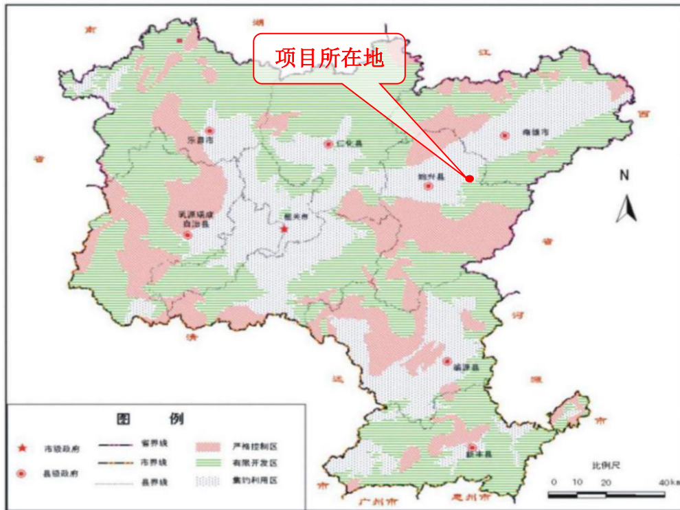
图-1 韶关市生态功能分区图

(2) 本项目属于建筑材料制造项目，根据《产业结构调整指导目录（2019 年本）》的规定，本项目不属于限制类、禁止类，符合相关的产业政策要求。