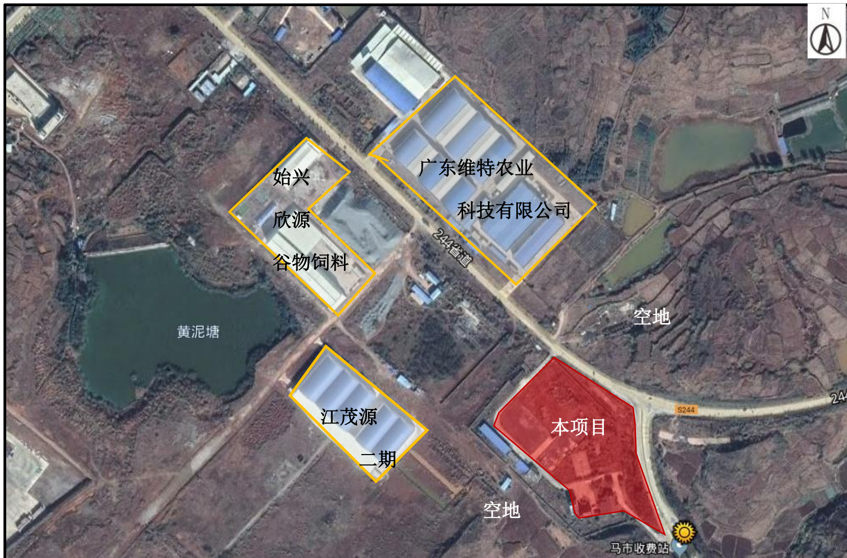
附图 2 项目四至图