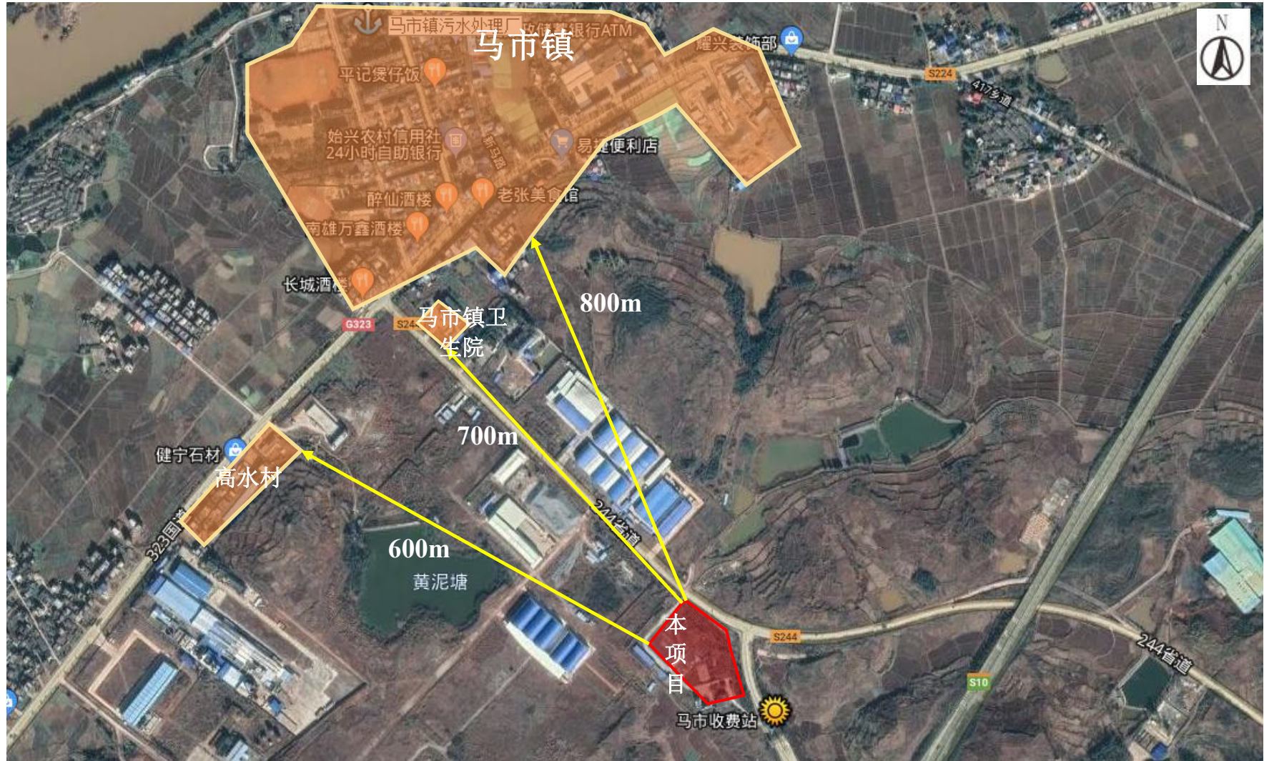
附图4 项目周边敏感点分布图